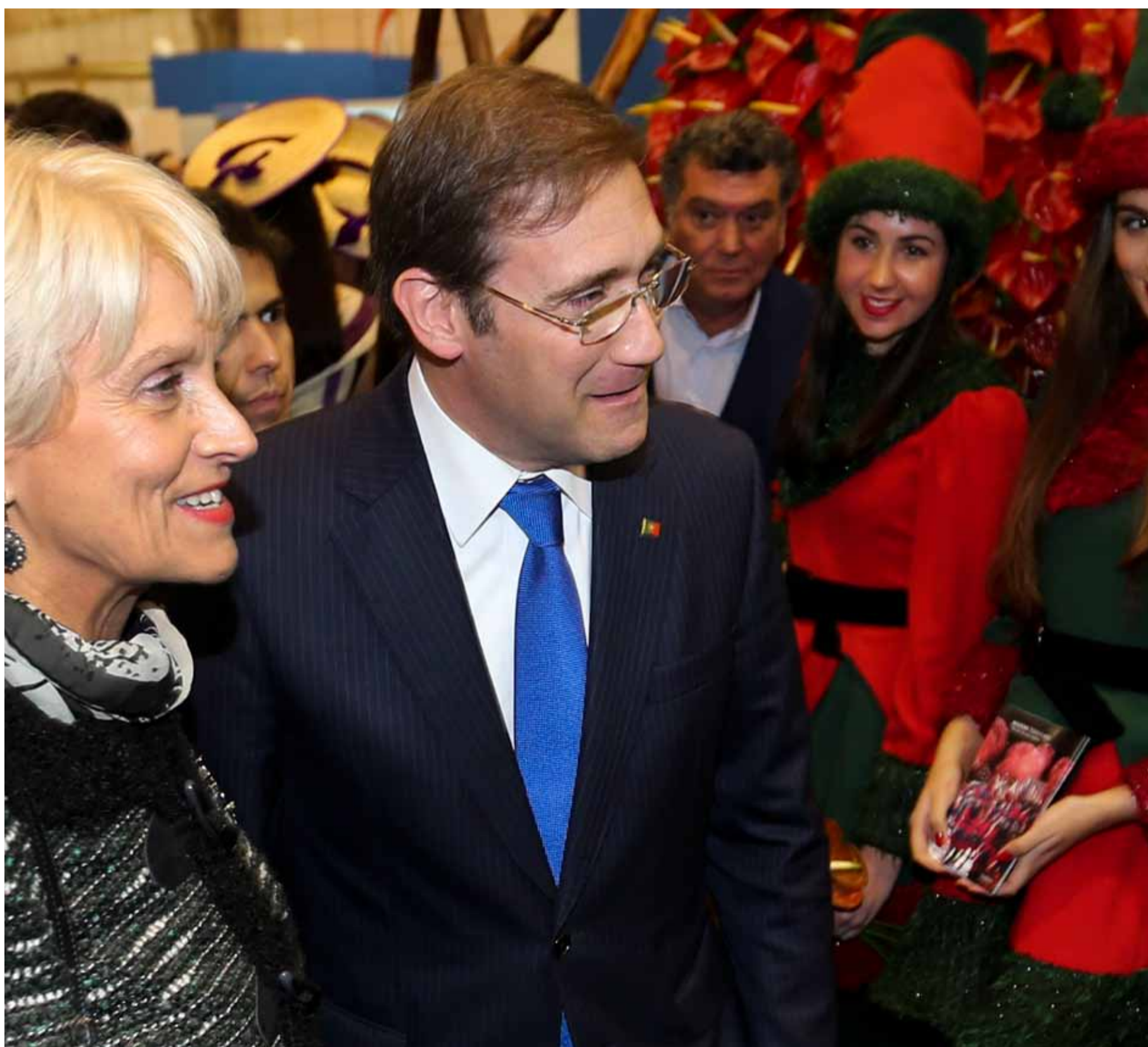
O Primeiro-Ministro visitou a Bolsa de Turismo de Lisboa (BTL)