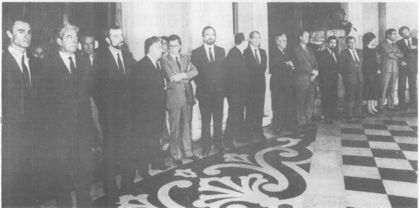
Os ministros do X Governo Constitucional, presidido pelo Prof. Cavaco Silva, e que foram empossados pelo Presidente da República no passado dia 6. O novo Gabinete é constituído exclusivamente por socialistas-democratas, com excepção do titular da pasta dos Negócios Estrangeiros, o Eng. Pires Miranda, que é independente. No mesmo acto, tomou também posse o secretário de Estado da Presidência do Conselho de Ministros, Pedro Santana Lopes. A cerimónia de posse dos restantes Secretários de Estado realizou-se no passado dia 8.