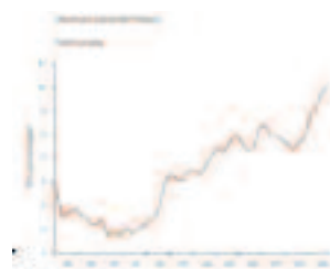
Quadro III: Taxa de Desemprego

A luta contra o desemprego, e mais em particular, contra o desemprego jovem tem de passar pela reforma das actuais políticas de qualificação.