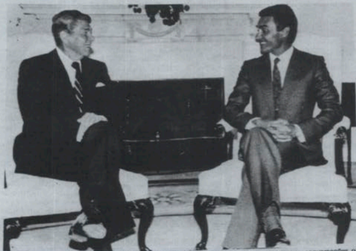
O Presidente Reagan e o Primeiro-Ministro de Portugal, Prof. Cavaco Silva, durante as conversações na Casa Branca, em Washington

... a viagem não... er referência a... adiantou Cavaco... ra recordar que... uma vez, numa... muito informal e... a que neste mo... ocorrem contactos... brito das Nações Uni... sobre o território, eu... dito que a Indonésia... tá interessada em criar